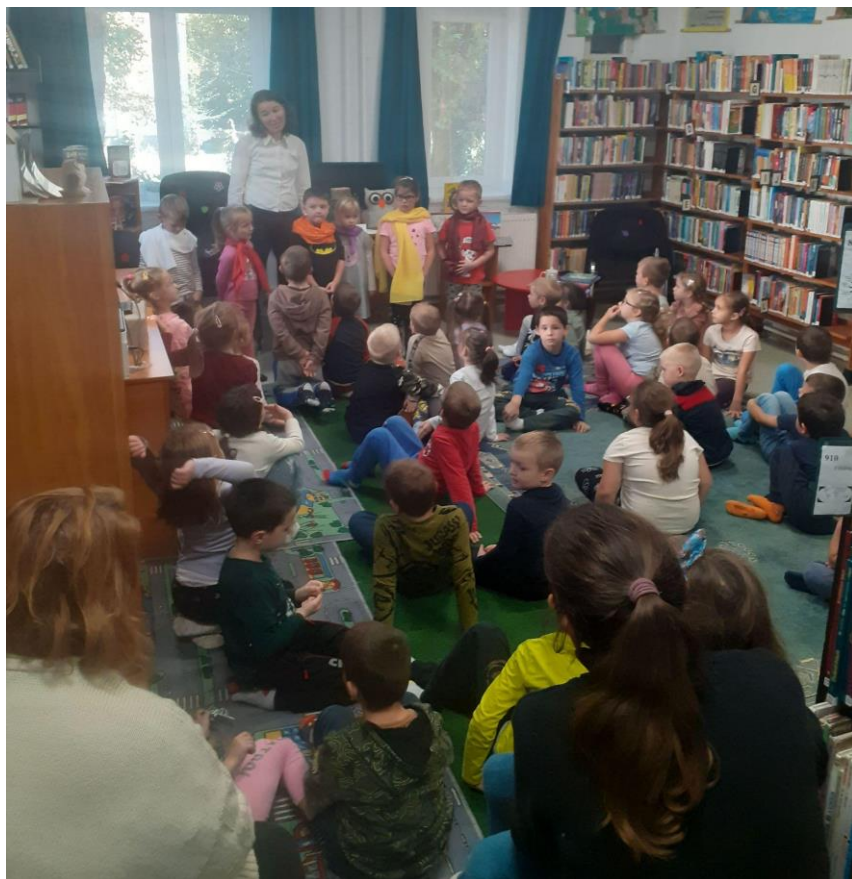
Vonatok és tündérek (Tab)