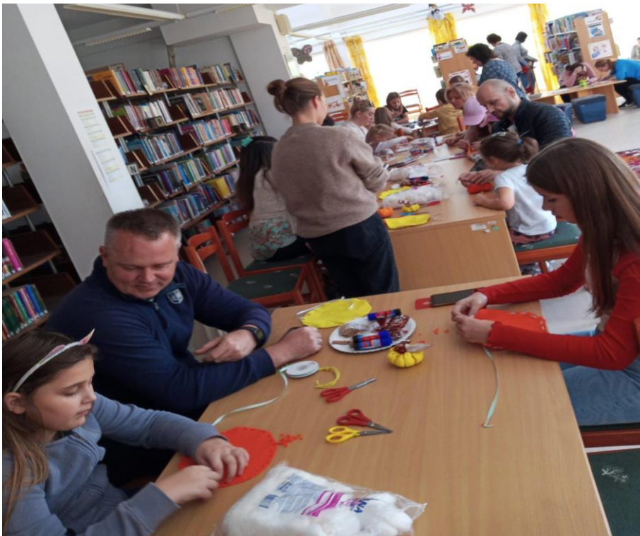
Családi játszóház (Kaposvár)