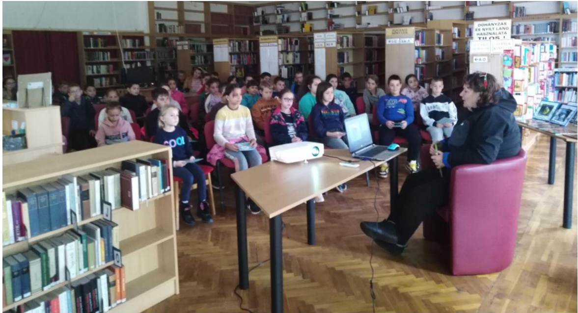
Csodálatos állatvilág (Kadarkút)