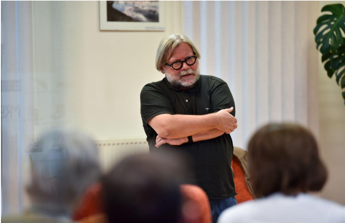
Oroszország és Ukrajna: békében és háborúban (Csurgó)