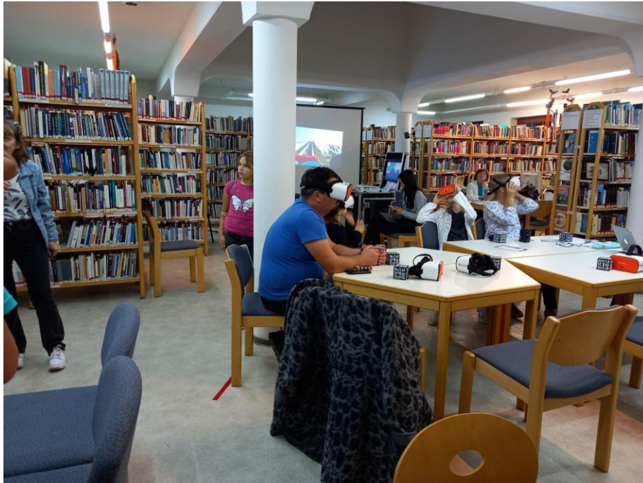
Digitális eszközök bemutatója (Balatonboglár)