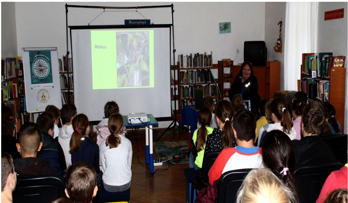
Csodálatos állatvilág (Nagyatád)