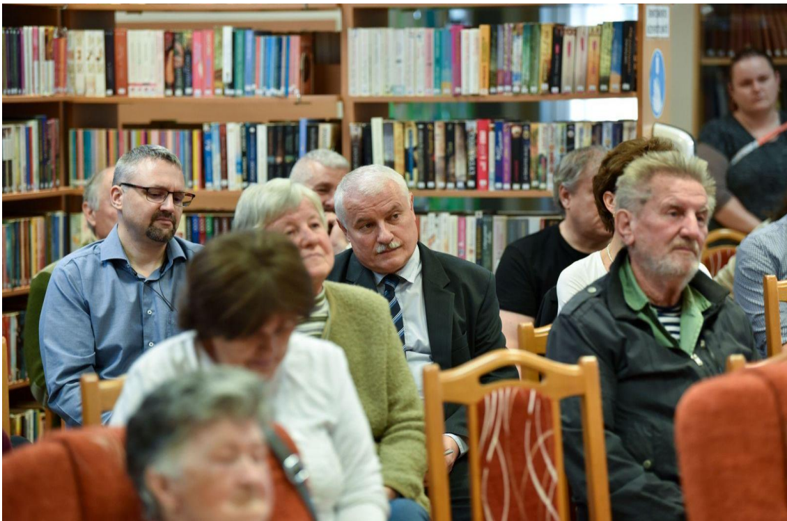
Oroszország és Ukrajna: békében és háborúban (Csurgó)