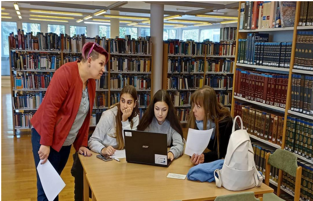
Geobook Caching (Kaposvár)