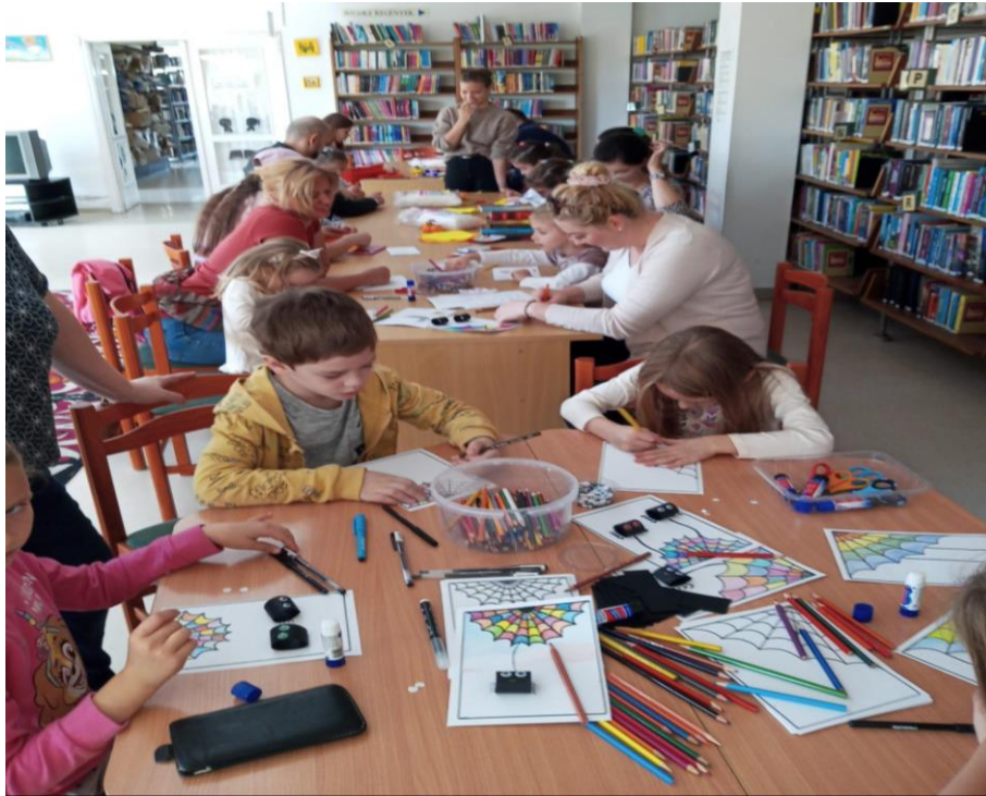
Családi játszóház (Kaposvár)