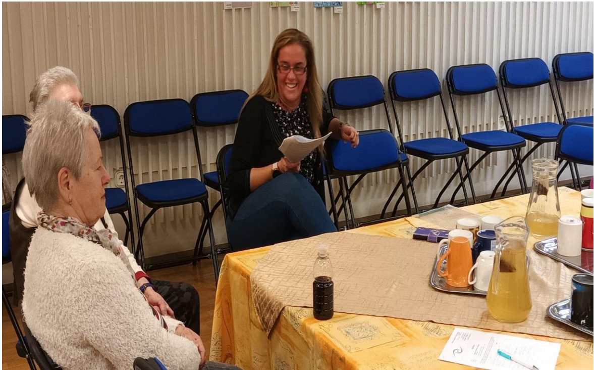
Biblioterápiás foglalkozás (Kaposvár)