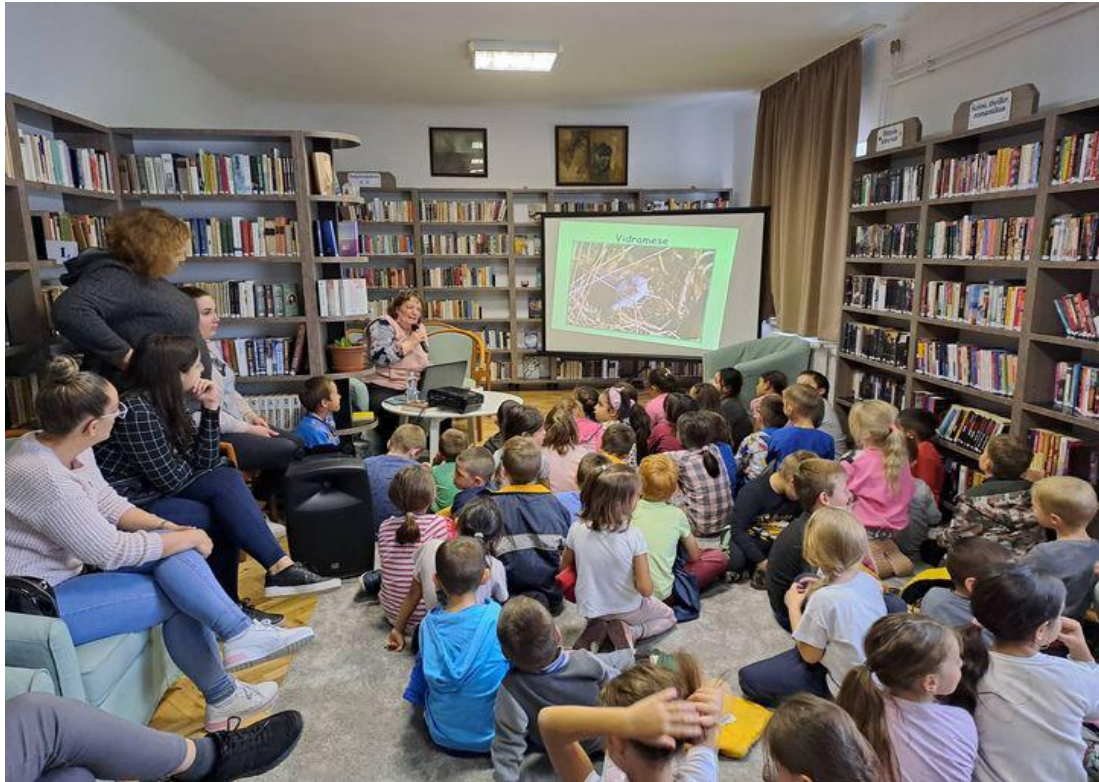
Csodálatos állatvilág (Nagybajom)