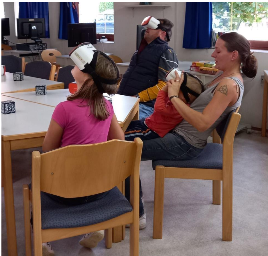
Digitális eszközök bemutatója (Balatonboglár)