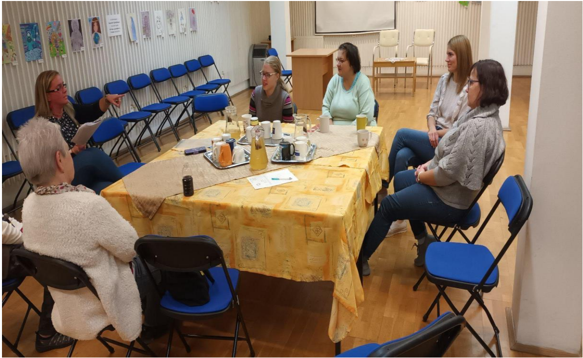
Biblioterápiás foglalkozás (Kaposvár)