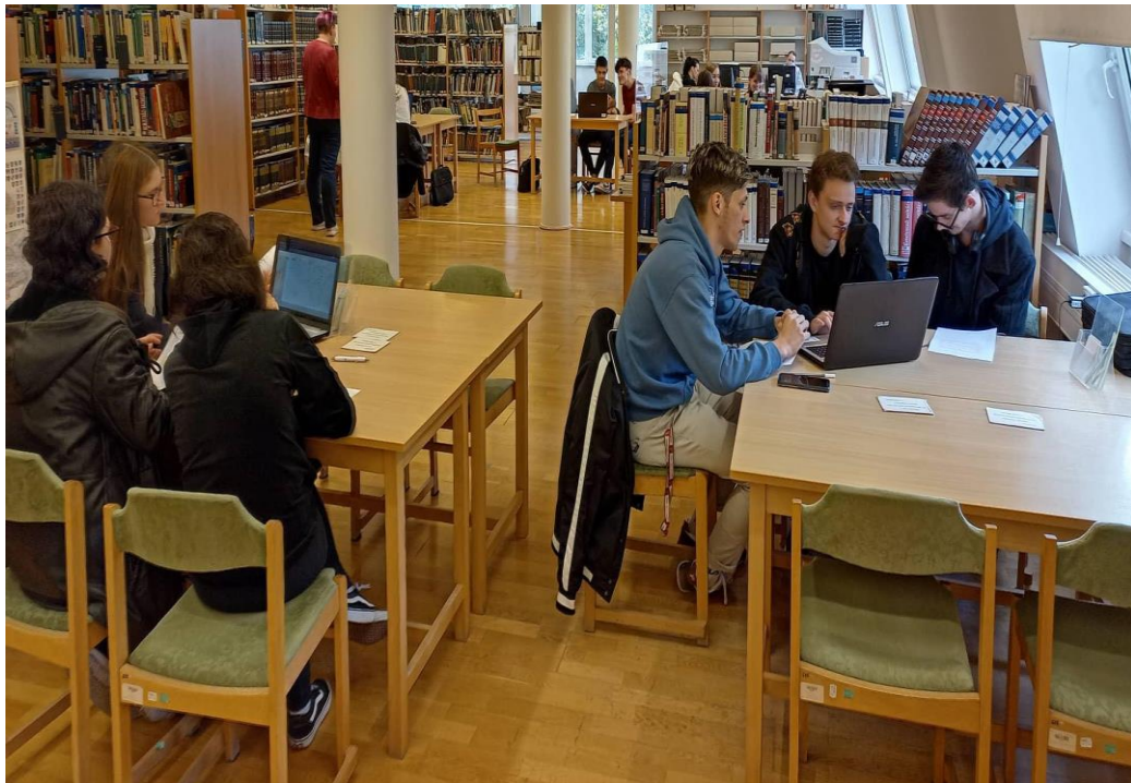
Geobook Caching (Kaposvár)