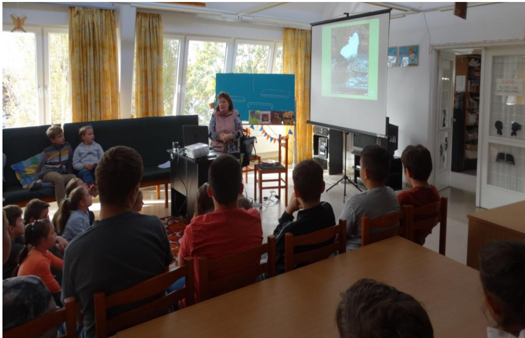
Csodálatos állatvilág (Kaposvár)