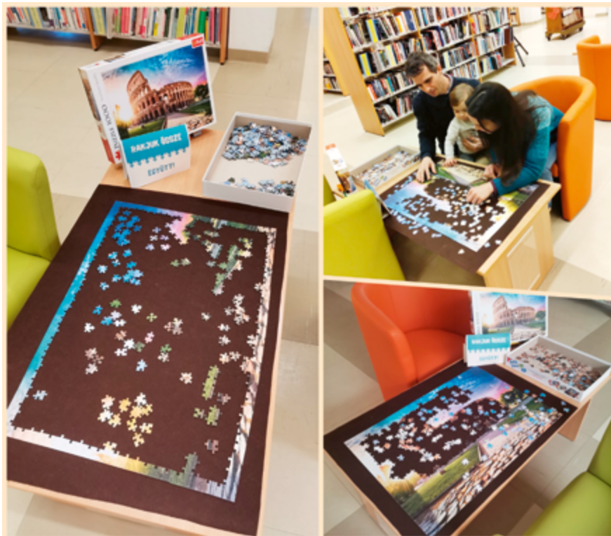
Grafikát készítette: Veizer Anita – Kaposvár