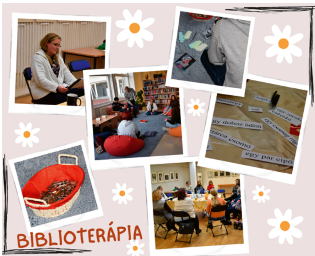
■ Grafikát készítette: Szőke Henrietta – Kaposvár

mindenkit, hogy egy ilyen jellegű segítő gondolkodás elsajátítása nagyon fontos és hogy jó, ha ehhez találnak maguk mellé egy barátot, társat. Ez egy tudatosan is felépíthető lelki folyamat, ami végül a segítség mellett a saját kiteljesedésünkhöz is vezethet. A novella helyenként túloz, ezeket a túlzásokat is megpróbáltuk kibozgani. A gyerekek konkrétan megfogalmazták, hogy miben érzik a túlzásokat, míg a felnőtteknél ez érdekesebben zajlott le. Először arról beszéltek, vagy úgy érezték, hogy ez a novella tulajdonképpen egy fikció és ilyen ember nem is létezik, de a felolvasás során folyamatosan – pont a túlzásoknak köszönhetően – alakult át